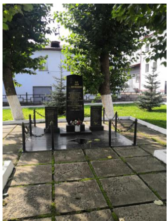
Памятник погибшим железнодорожникам в г. Кирове (расположен рядом с домом № 44 по ул. Комсомольская)