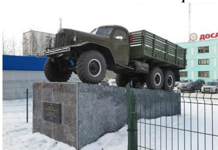
Памятник воинам-автомобилистам к 90-летию ДОСААФ России в г. Кирова на просп. Строителей, 21В