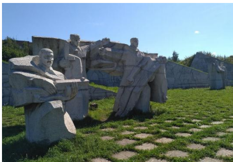
Курган Великой Отечественной войны в парке имени 50-летия ВЛКСМ в г. Кирове